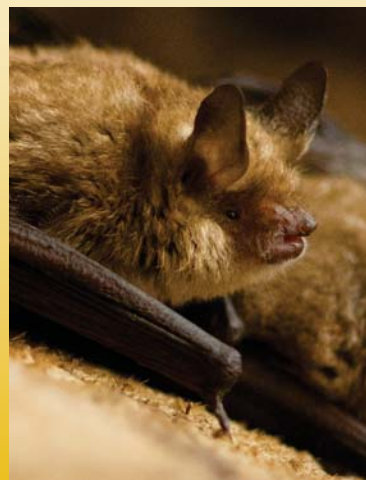
MURIN À OREILLES ÉCHANCRÉES - MYOTIS EMARGINATUS